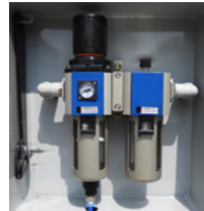
Levegő előkészítő és nyomásszabályzó