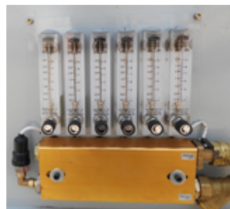
Vízhűtés áramlás szabályzó és mérő