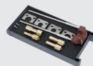
Tárolódoboz az ARCPULL 700 fogyóeszközöknek 068322