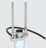
Pisztolyláb gázvédelemmel 068346